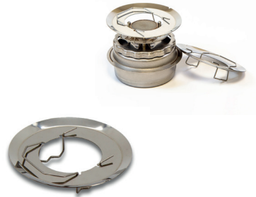
Soporte p/chafo ecobost mini. EcoBurner. Ref.: 1006192 u/c: 1 P.V.P.: 8,90 €/U