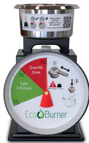
Báscula. EcoBurner. Ref.: 1005976